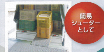
簡易シューターとして