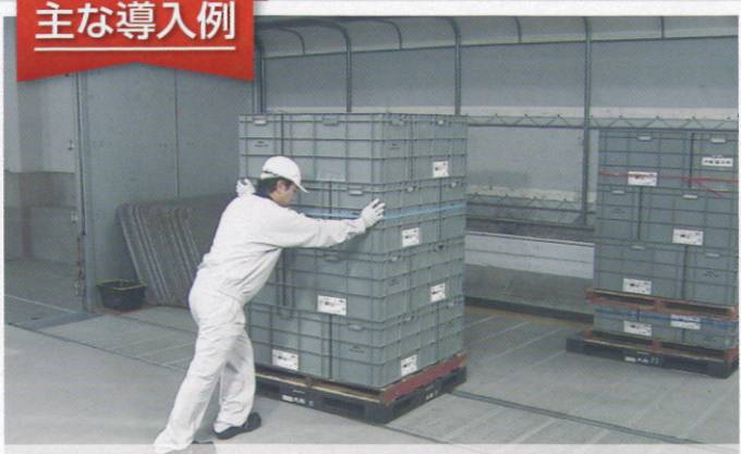
トラックにもμデッキパネルを施工し大幅に工数低減