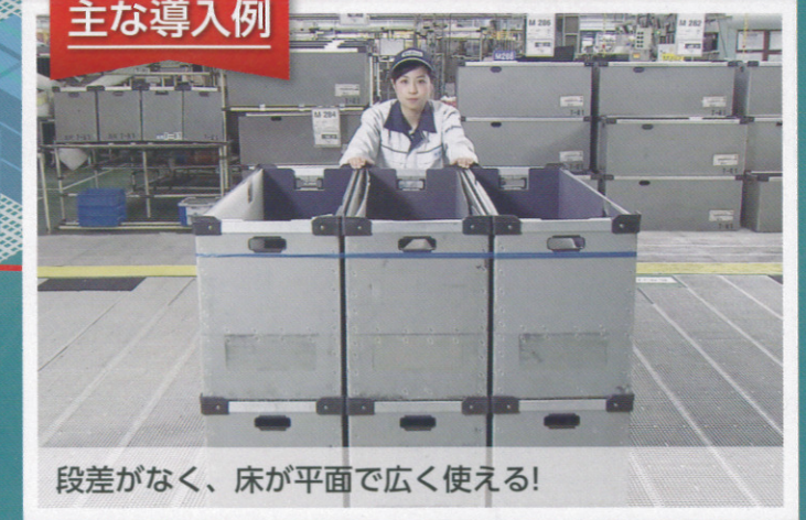
段差がなく、床が平面で広く使える!