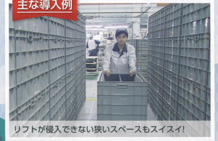
リフトが侵入できない狭いスペースもスイスイ!