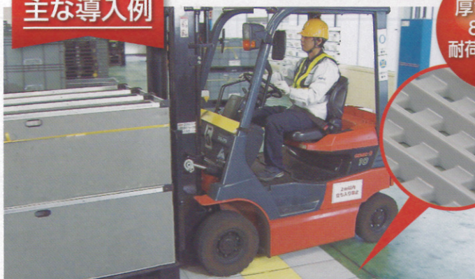
床がフラットなので、リフトの乗り入れもスムーズ